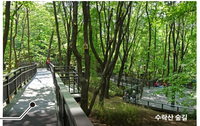
나무데크로 만든 산책길