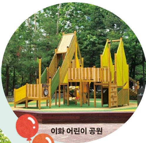
이화 어린이 공원

위 소식이 더 궁금하다면? ☎ 02-2116-3966 노원구청 푸른도시과