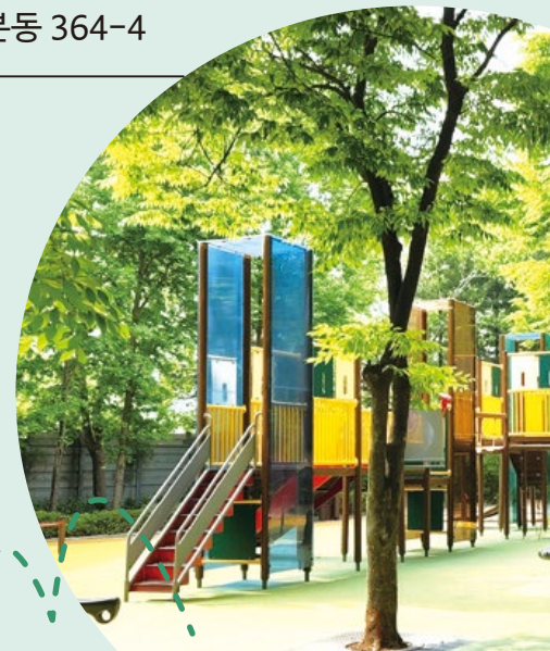
나팔꽃 어린이 공원