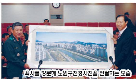
육사를 방문해 노원구전경사진을 전달하는 모습

또한 구청에서 실시하는 행사의 경우 차별화를 두어 저렴한 비용으로 대여할 수 있도록 적극 검토할 것을 약속하고, 육군사관학교가 추진 중인 다양한 개방 및 개혁프로그램에 대해 구가 적극적으로 협력해 줄 것을 당부했다.