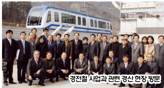
경전철 사업과 관련 경산 현장 방문

지난 4월4일, 서울에서 '서울시 10개년 도시철도 기본계획' 중 경전철 4개 노선을 발표했다. 노원구 노선을 포함, 우선사업대상지역으로 선정되까지 그간 구가 추진한 일련의 과정을 주민 여러분께 소상히 밝혀 이해를 돕고자 한다. - 편집자주 -