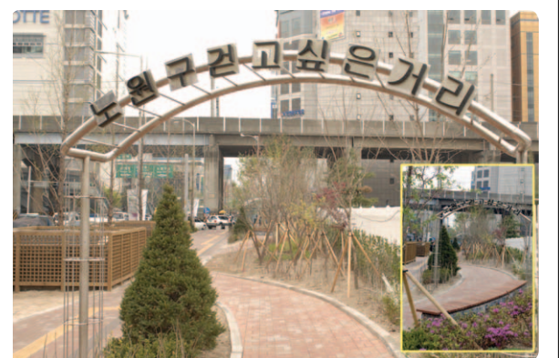
도봉운전면허시험장 앞 인도 420m 구간에 '걷고싶은 거리'가 조성되어 각종 초목이 우거진 도심 속 쉼터 역할을 할 것으로 기대된다.