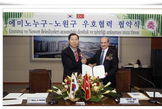
지난 19일 터키공화국 에미노누구와의 조인식 모습

내용도 포함되어 있어 양측은 우호관계를 넘어 자매도시 관계까지 발전할 전망이다.