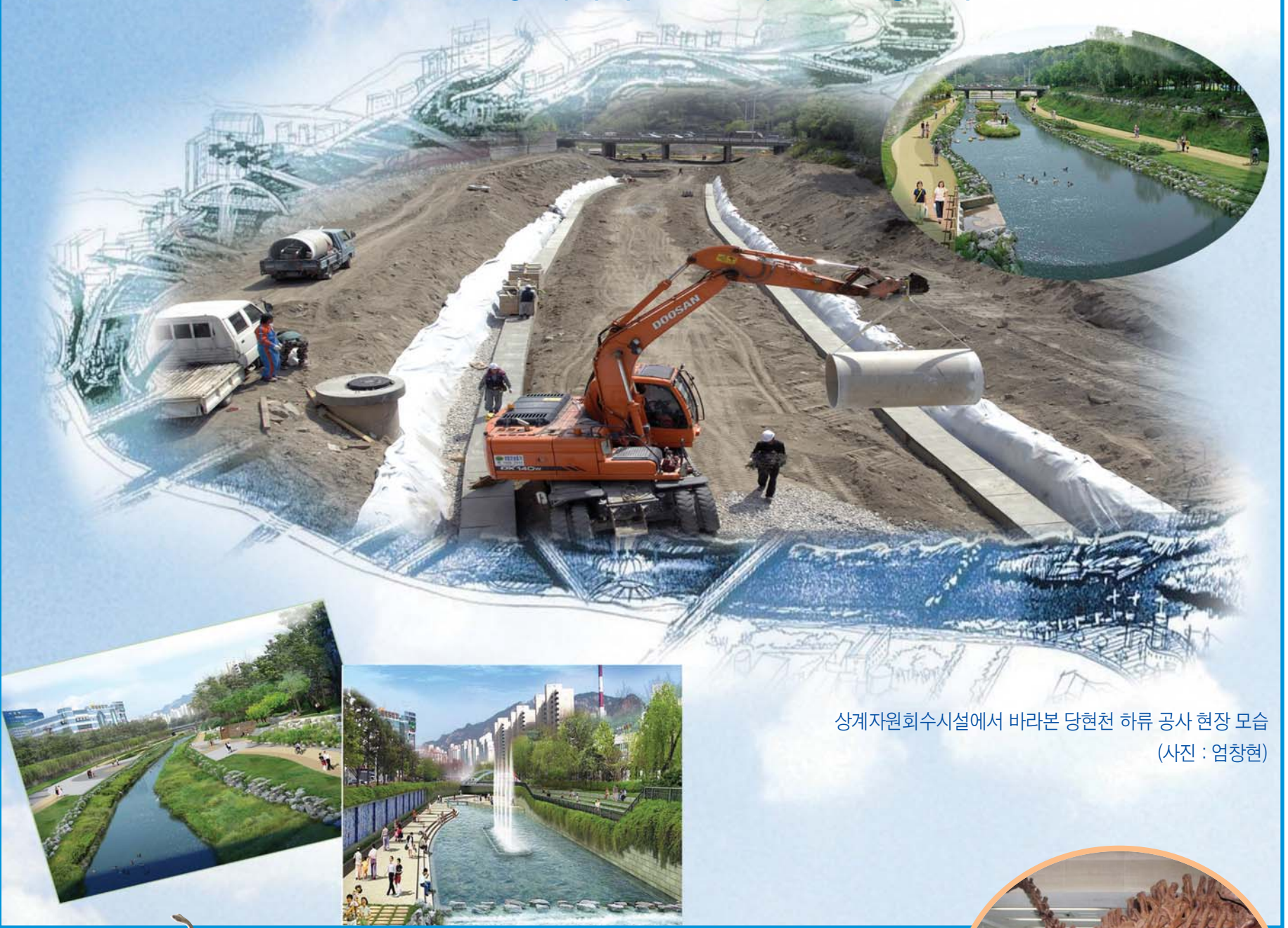
상계자원회수시설에서 바라본 당현천 하류 공사 현장 모습