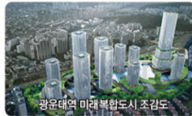
광운대역 미래 복합도시 조감도