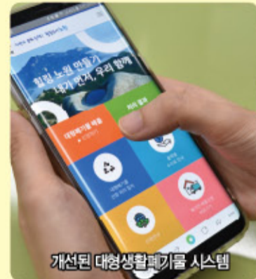
개선된 대형생활폐기물 시스템