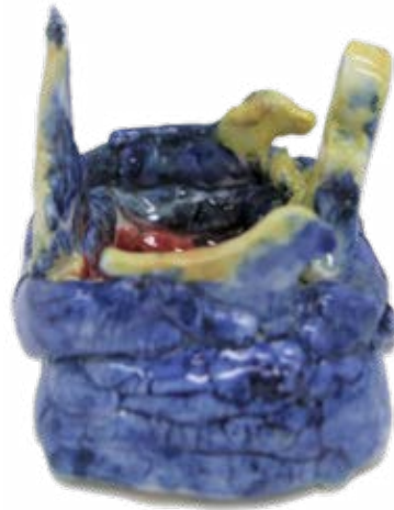
박지호, <새와 강아지>