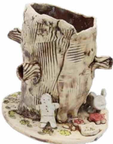
김태경, <나무와 꽃>