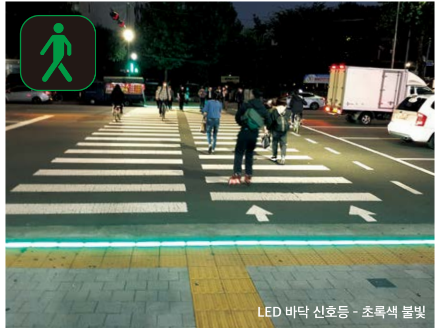
LED 바닥 신호등 - 초록색 불빛