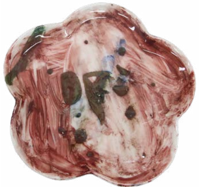
이예림, <나의 예쁜 접시>