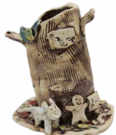
조예준, <나와 강아지>