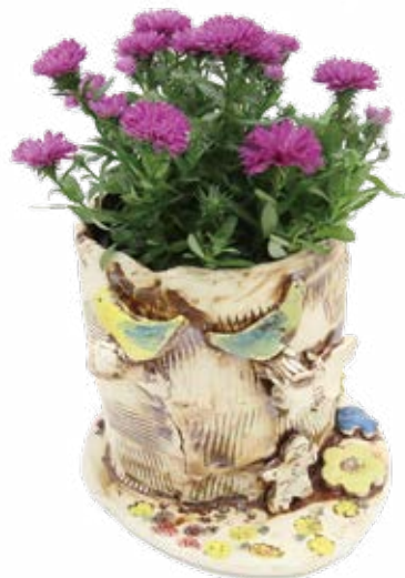
양시울, <내 화분>