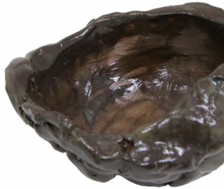
함연동, <작은 어항>

전시 바로 가기 시민 기자 박지호 missyou2002@naver.com