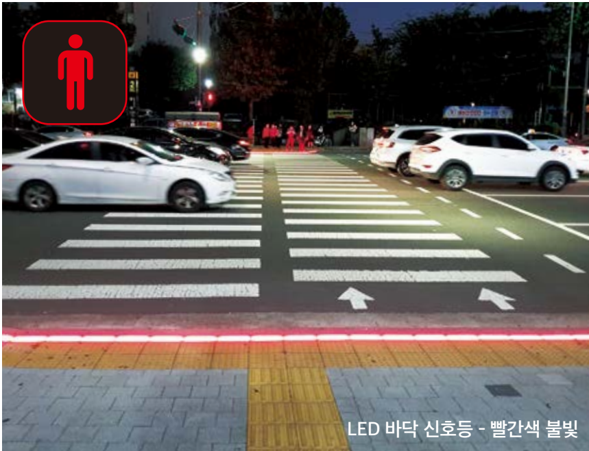
LED 바닥 신호등 - 빨간색 불빛