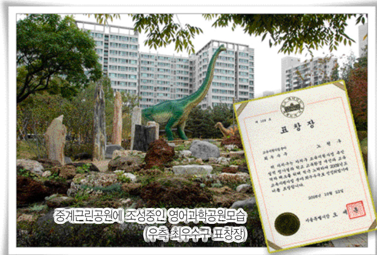
중계근린공원에 조성중인 영어과학공원모습 (우측 최우수구 표창장)