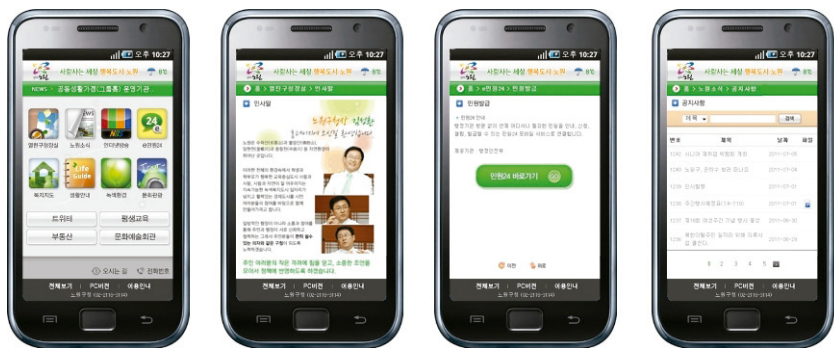
<노원 모바일 홈페이지>

우리구에서는 본격적인 스마트폰 시대에 맞춰 스마트폰 이용자의 편의를 위해 '모바일 홈페이지'를 구축하여 서비스를 실시한다.