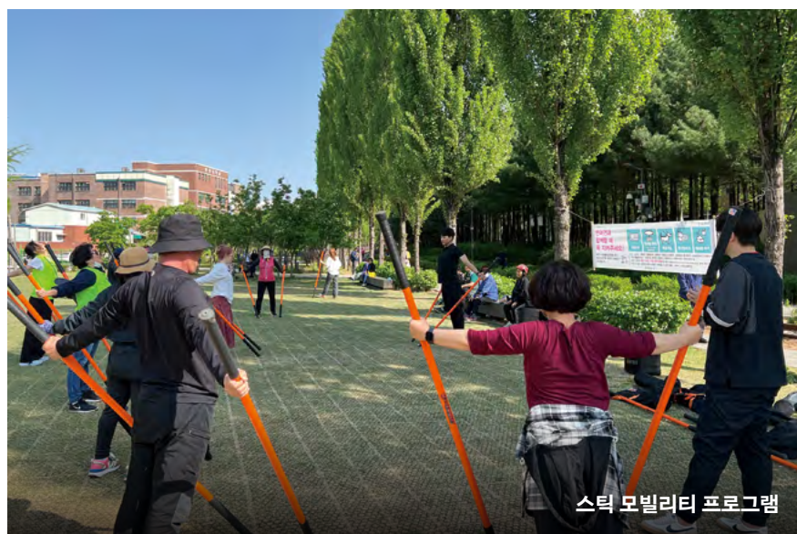
스틱 모빌리티 프로그램

어르신을 위한 프로그램으로, 긴 막대를 이용해 스트레칭과 운동을 할 수 있는 '스틱 모빌리티' 프로그램도 준비되어 있다.